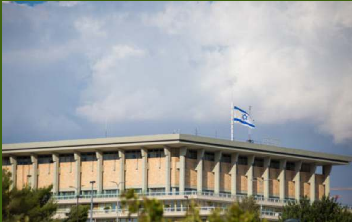
Budynek Knesetu przy Givat Ram w Jerozolimie (od 1966 roku)

Konferencja Naukowa ŻYDZI EUROPY WSCHODNIEJ I POLITYKA BIOGRAFIE – IDEE – TEKSTY KULTURY Program Białystok 2022