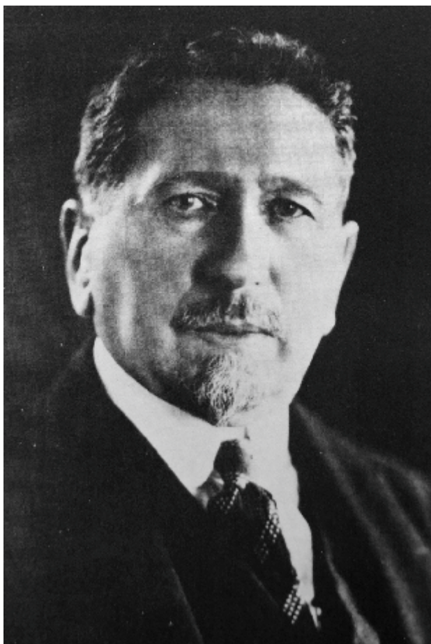
Nachum Sokołow (1859-1936), piąty prezydent Światowej Organizacji Syjonistycznej