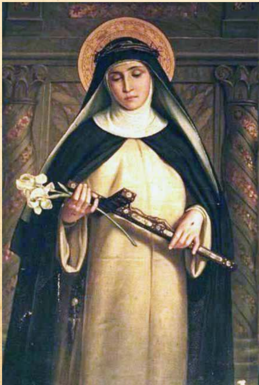
Św. Katarzyna ze Sieny, Kościół Santa Maria del Rosario in Prati, Rzym