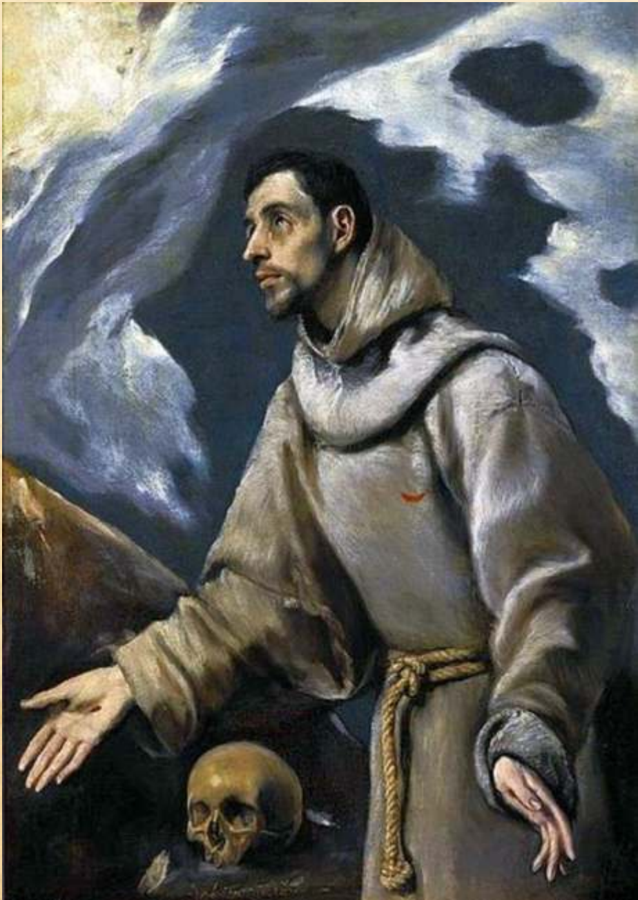
El Greco (właśc. Domenikos Theotokopulos, 1541–1614), Ekstaza św. Franciszka , Muzeum Diecezjalne w Siedlcach