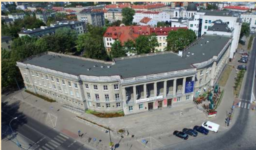
Budynek Wydziału Filologicznego i Wydziału Historii i Stosunków Międzynarodowych UwB. Dawniej: Komitet Wojewódzki PZPR. Projektant: Stanisław Bukowski, 1953–1954