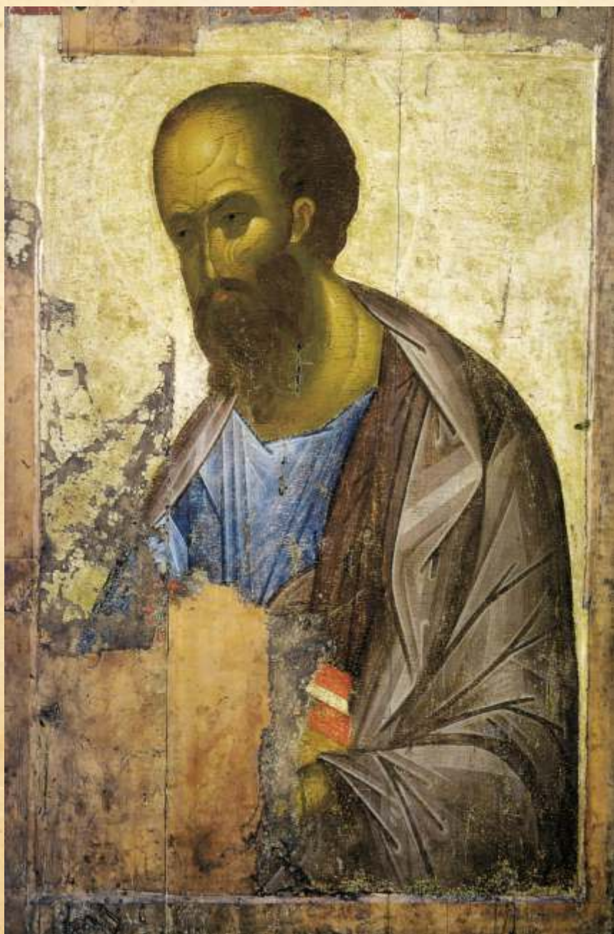
Andriej Rublow (ok. 1360 – ok. 1430), Ikona św. Pawła Apostoła , XV w.