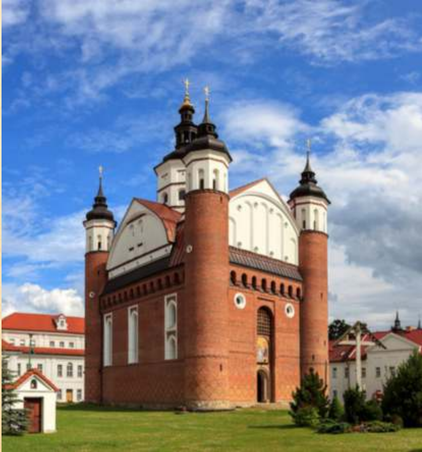
Monaster Zwiastowania Przenajświętszej Bogurodzicy i św. Apostoła Jana Teologa, Ławra Suprańska [przed 1497]